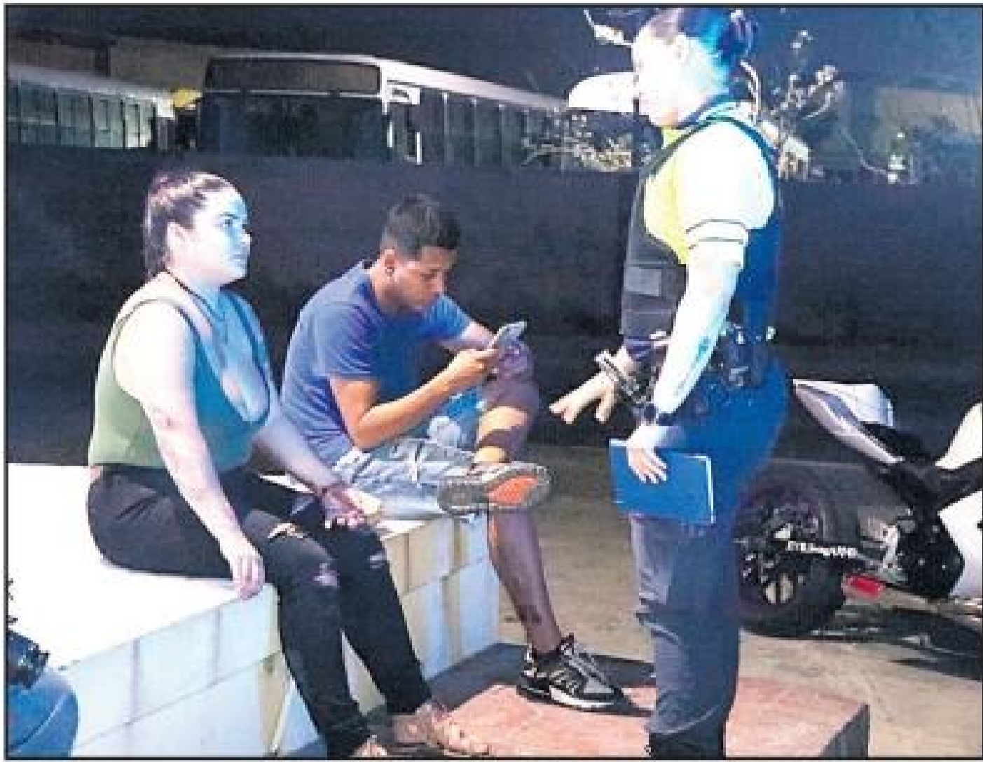
Wayaca - Diabierna anochi polis pasando altura di DHL na Wayaca a topa cu un pareha. E dama tawata herida. Nan lo a caba di haya

accidente cu e brommer cu nan tawata ariba dje. Tawata tin dos brommer benta ariba caminda, di cual uno e dama tawata cu ne.